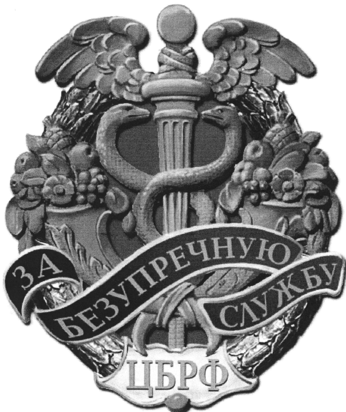
Рисунок нагрудного знака «За безупречную службу в Банке России»