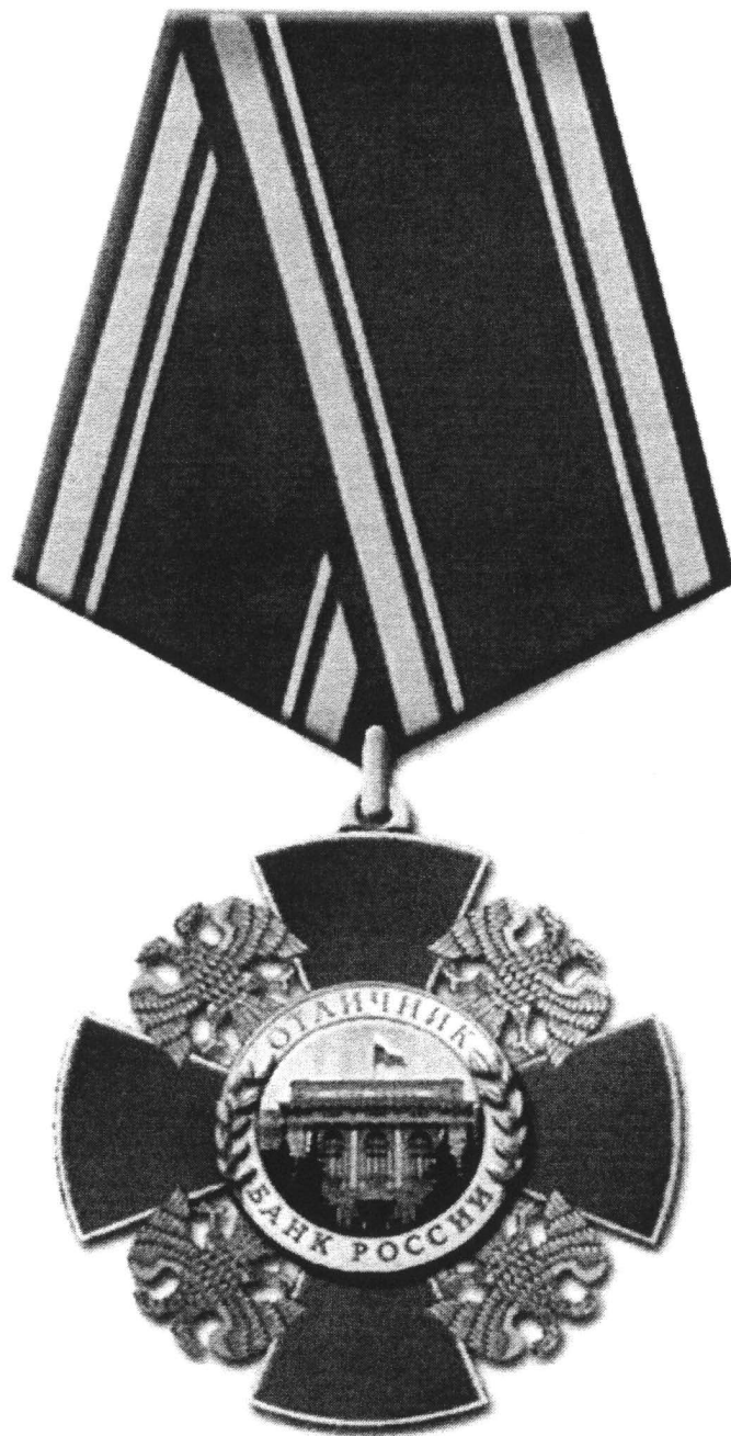
Рисунок нагрудного знака к почетному званию «Отличник Банка России» и фрачного значка к почетному званию «Отличник Банка России»