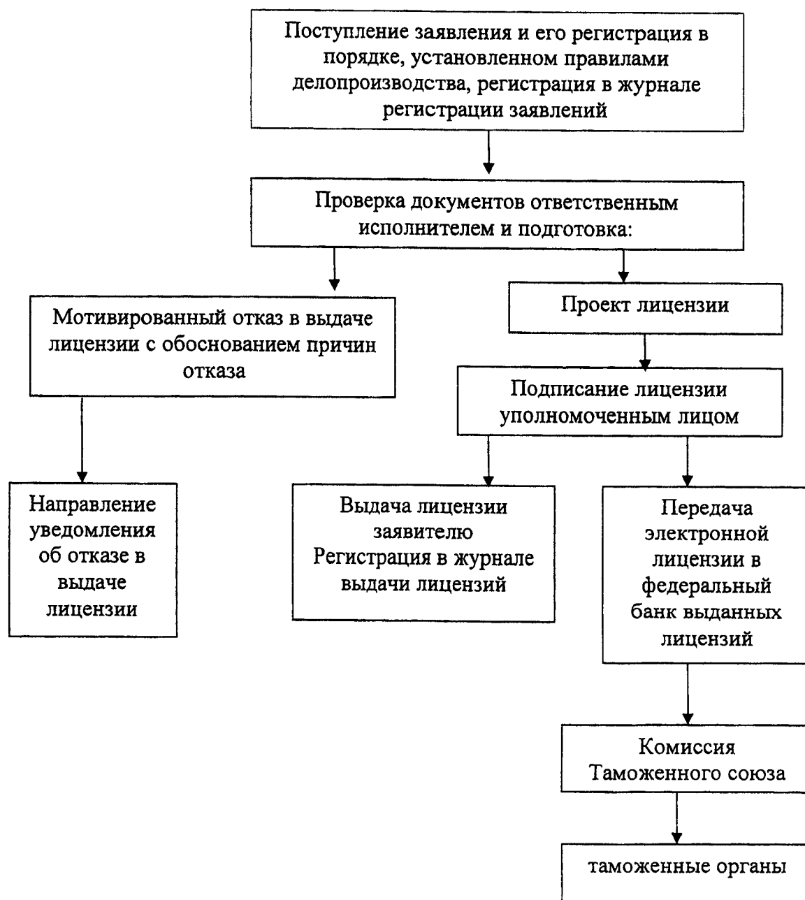
Схема исполнения административных процедур, выполняемых при предоставлении государственной услуги по рассмотрению документов и принятия решений о выдаче лицензий на экспорт и (или) импорт отдельных видов товаров