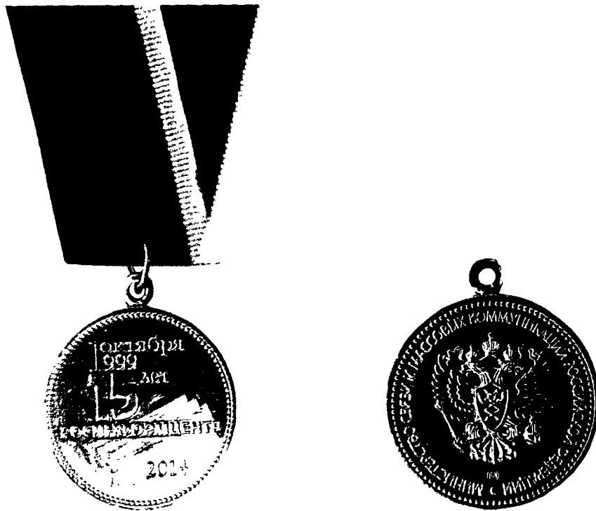
РИСУНОК памятной медали «15 лет Росинформцентру»

к приказу Министерства связи и массовых коммуникаций Российской Федерации от 12.09.2014 № 235